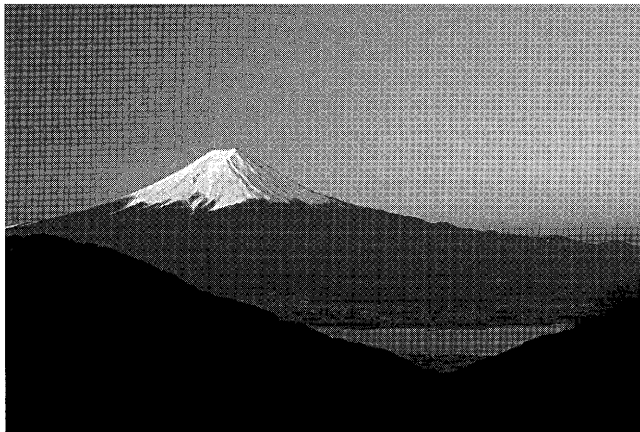
ふがくひゃっけい 富嶽百景 (1939 山梨県富士河口湖町) 太宰 治

太宰治は、根強くファンに愛される一方で、代表作に挙げられる「人間失格」などのイメージから「暗い」と評されがちな作家です。しかし、1939年発表の『富嶽百景』を読めば、そのイメージは変わるでしょう。